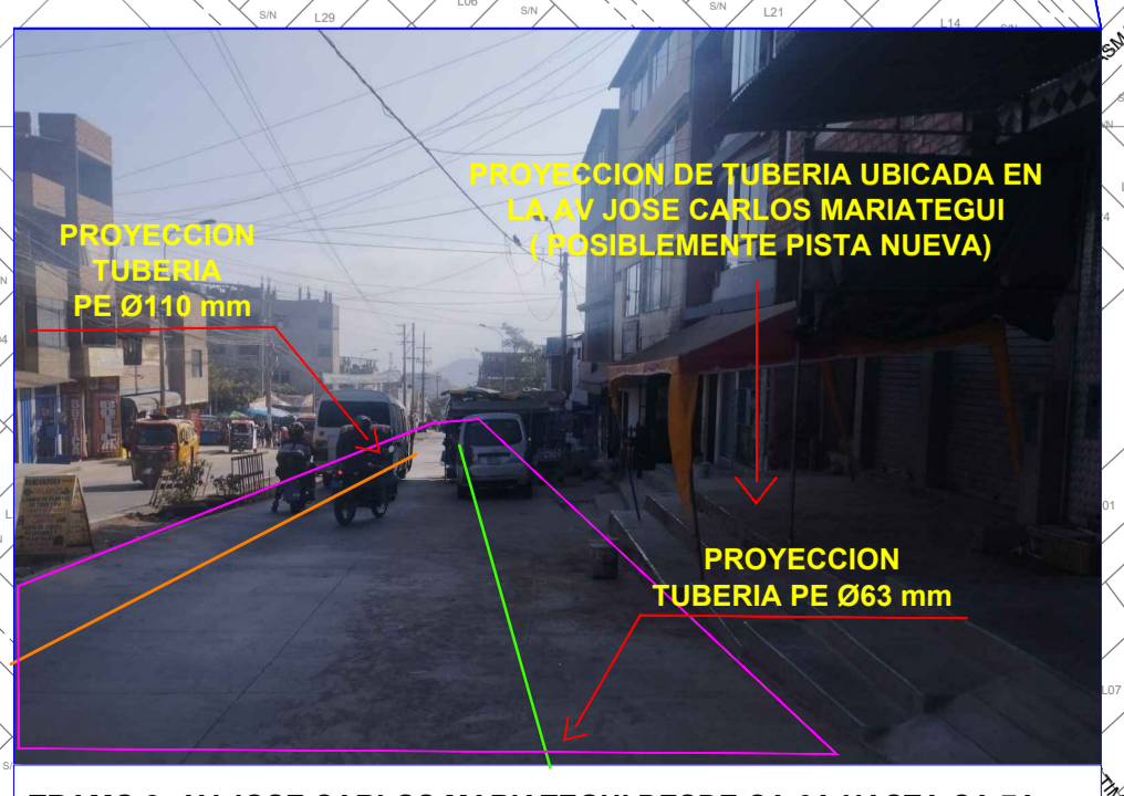
TRAMO 2: AV JOSE CARLOS MARIATEGUI DESDE CA 6A HASTA CA 7A