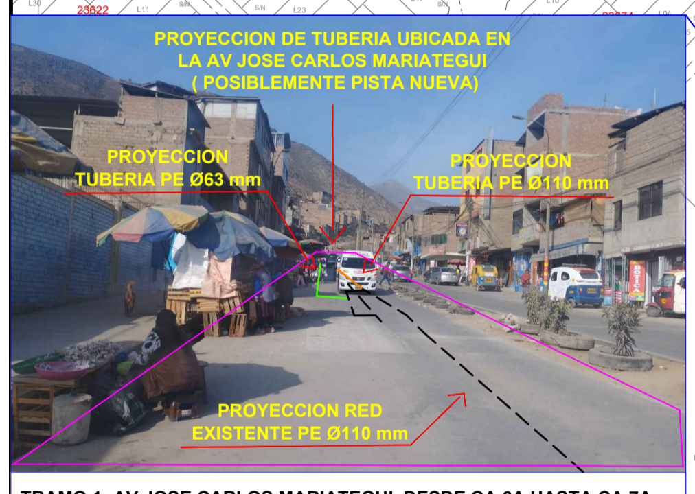
TRAMO 1: AV JOSE CARLOS MARIATEGUI DESDE CA 6A HASTA CA 7A