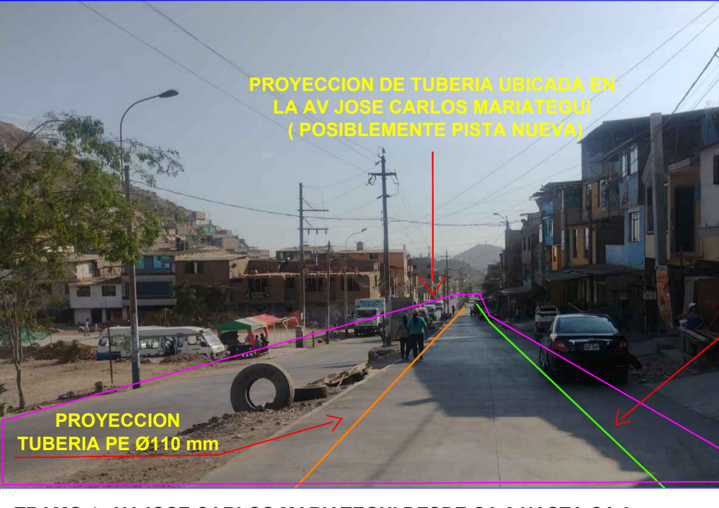
TRAMO 4: AV JOSE CARLOS MARIATEGUI DESDE CA 8 HASTA CA 9